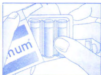
1 - Sortir la barquette de 3 doses de l'étui.