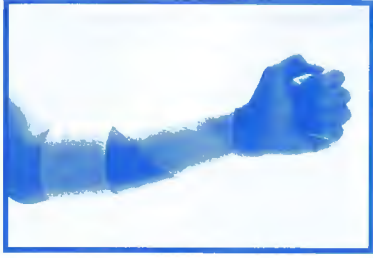
Tendinites du coude et du poignet