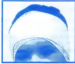
Plaies de la tête