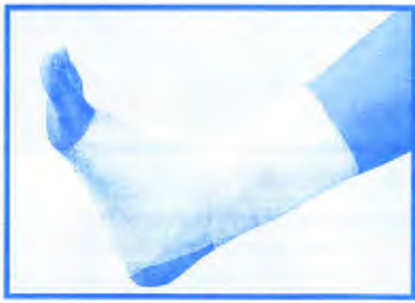
Entorses bénignes de la cheville